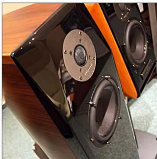
Černé čelo s vysokým leskem je bezchybné - na Taiwanu se naučili dosáhnout evropské úrovně kvality. Středobasový reproduktor je dle slov zástupce Usher „Stihající, ale přeci jen o úroveň níž...“ než výškáč. Je to tak...